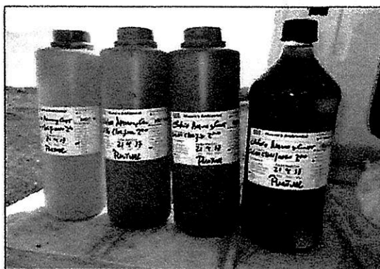
Fotografía 1: Set de Batería